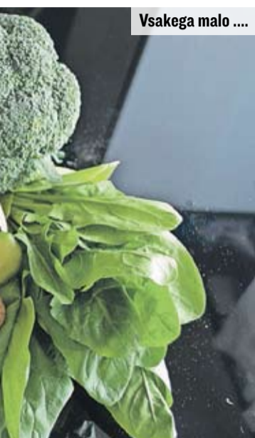
Vsakega malo ....

se nam zdijo prekislji, ali javorjev sirup.