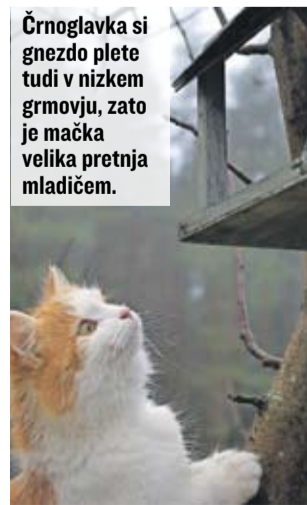
Črnoglavka si gnezdo plete tudi v nizkem grmovju, zato je mačka velika pretnja mladičem.

krat le do Primorja ali malo dlje v sredozemski kraje, predvsem v milih zimah pa prezimujejo kar pri nas. Zanimivo je, da sta njena pogosta zgodnja spomladanska hrana medicina in cvetni prah vrbe in leske pa tudi drugih rastlin in tako nehote pripomore k opravevanju. Od začetka do konca gnezdenja se črnoglavka prehranjuje skoraj izključno z žuželkami, pajki, majhnimi hrošči, listnimi stenicami, muhami, včasih tudi z gosonicami, loti se celo kakšnega polža. Pozneje počasi prehaja na razno jagodičevje in sadje. Na Primorskem se jeseni rada loti fig, kar kmetom povzroči tudi nekaj škode, višje pri nas pa jo pogosto vidimo v bezgovem grmu z zreliimi jagodami. Mar tudi črnoglavka ve, da so bezgove jagode zelo zdrave? Celo tako zdrave, da bi se vsak možki moral pred grmom bezga odkriti. Tudi jaz bi se, pa se ne bom! Svoje plešaste butice pa že ne bom razkazoval vesoljnemu svetu. ■