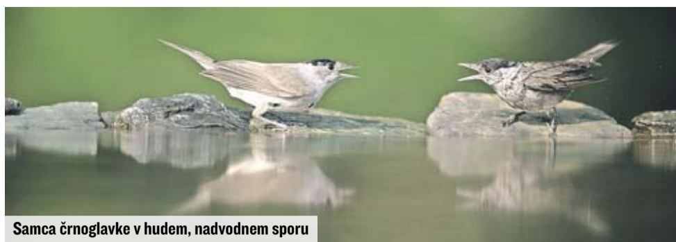
Samca črnoglavke v hudem, nadvodnem sporu

Mesečna izmenjava se običajno dogaja vsako zadnjo sredo v mesecu od 17. do 19. ure na Waldorfski šoli, v novem prizidku na Streliški 12 v Ljubljani, včasih pa jo organizirajo na željo ljudi tudi v kakšnem drugem terminu. Več lahko izvem na http://www.tekstilnica.si/ . In da ne boste rekli, da za dogajanje vedno izveste šele, ko je že mimo, vam povem, da bo v sredo, 11. decembra, izmenjava namenjena le otroškim oblačilom in drugim otroškim stvarim. Potekala bo ravno tako na Waldorfski šoli, ob istih urah kot navadno. Na tokratno otroško izmenjavo izjemoma lahko prinesete poljubno število čistih in lepo ohranjenih stvari in potem izberete in odnesete enako število kosov, kot ste jih sami prinesli. ■