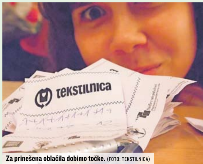
Za prinesena oblačila dobimo točke.

Na splošno so ljudje zadovoljni, seveda pa so med obiskovalci tudi takšni, ki so razočarani. Nemogoče je ugoditi vsem pa