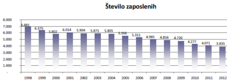
Tabela: Število zaposlenih v slovenski papirni industriji po letih

Število zaposlenih v panogi C17 se je v letu 2012 znižalo za 4,7 %, od tega v papirnicah za 14,1% (Radeče papir); (CEPI povprečje je -1,6%). V zadnjem obdobju so št. zaposlenih najbolj zmanjševala srednja in velika podjetja.