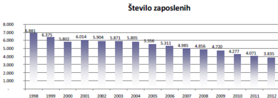
Tabela: Število zaposlenih v slovenski papirni industriji po letih

Število zaposlenih v panogi C17 se je v letu 2012 znižalo za 4,7 %, od tega v papirnicah za 14,1% (Radeče papir); (CEPI povprečje je -1,6%). V zadnjem obdobju so št. zaposlenih najbolj zmanjševala srednja in velika podjetja.