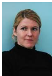
Urša Zgojznik predsednica